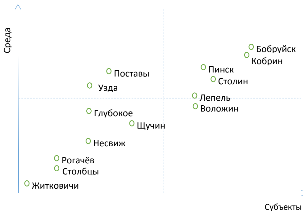
Рисунок 1. Общее развитие городов

Таким образом, с учетом данного ранжирования, а также учитывая географическую локализацию в разных регионах и первичную готовность местных субъектов к кооперации для запуска локального планирования, было решено остановиться для дальнейших действий на городах: Бобруйск, Щучин, Воложин, Столин, Лепель.